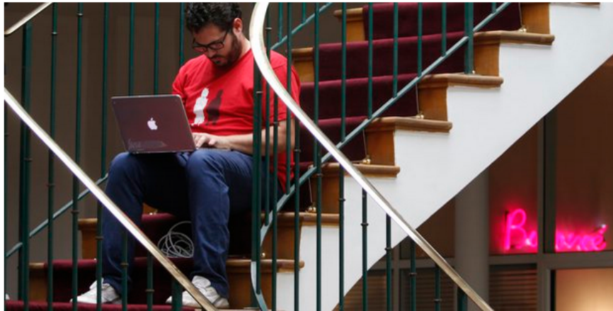
Von überall auf der Welt in die Uni – so funktionieren Moocs.

Die ersten Unis kehren Moocs den Rücken. Zu Recht, meint der Präsident der University of Southern California . Dennoch gibt er Moocs eine zweite Chance.