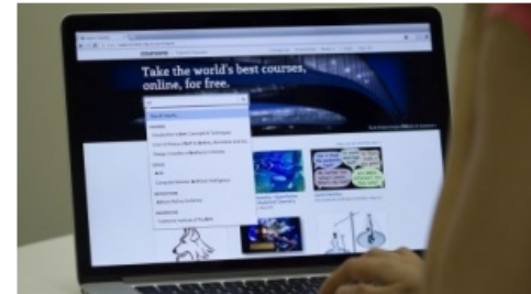
Coursera ist die Online-Lernplattform von Andrew Ng.

Bildung für manche statt für alle: Drei Jahre nach der ersten Euphorie ist klar, dass die MOOCs genannten Onlinekurse trotz großen Erfolgs nicht die Massen erreichen. Der Informatiker und Stanford-Proffessor Andrew Ng will sich trotzdem nicht von der Wunschvorstellung verabschieden.